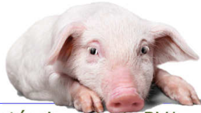
Resistència variable RV1